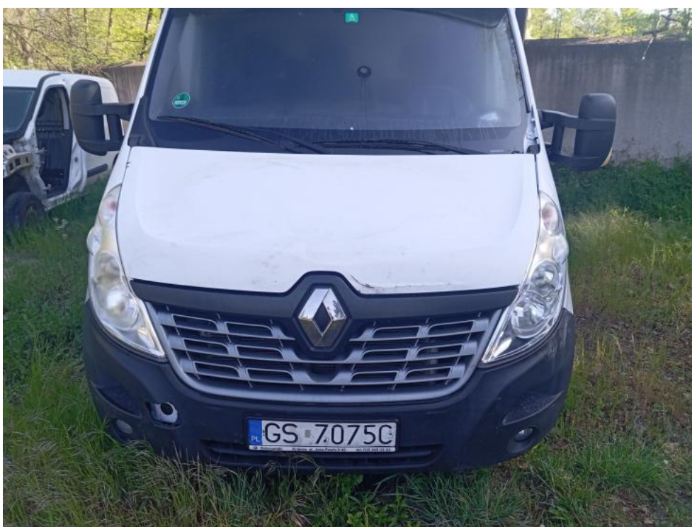
Fot. 68. - deformacja 1