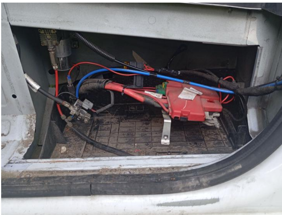
Fot. 39. Zdjęcie do protokołu