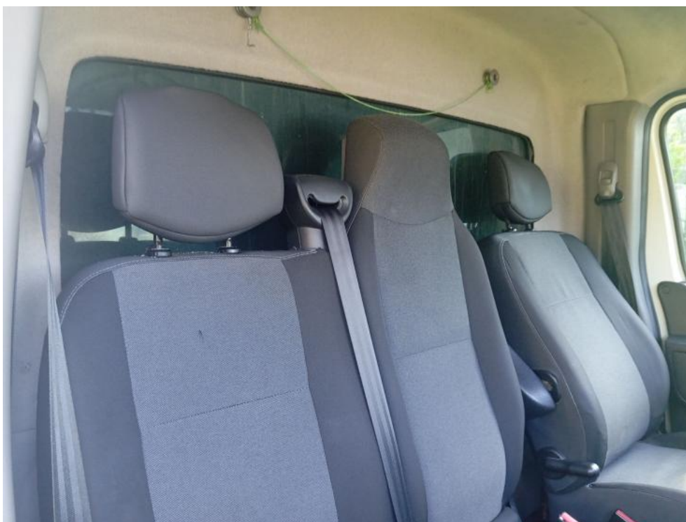
Fot. 27. Widok tyłu wnętrza kabiny