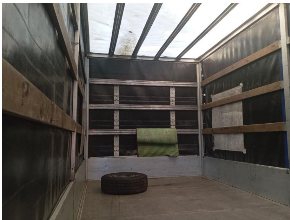
Fot. 36. Zdjęcie do protokołu