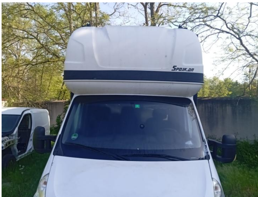
Fot. 3. Przód prostopadle góra (szyba)