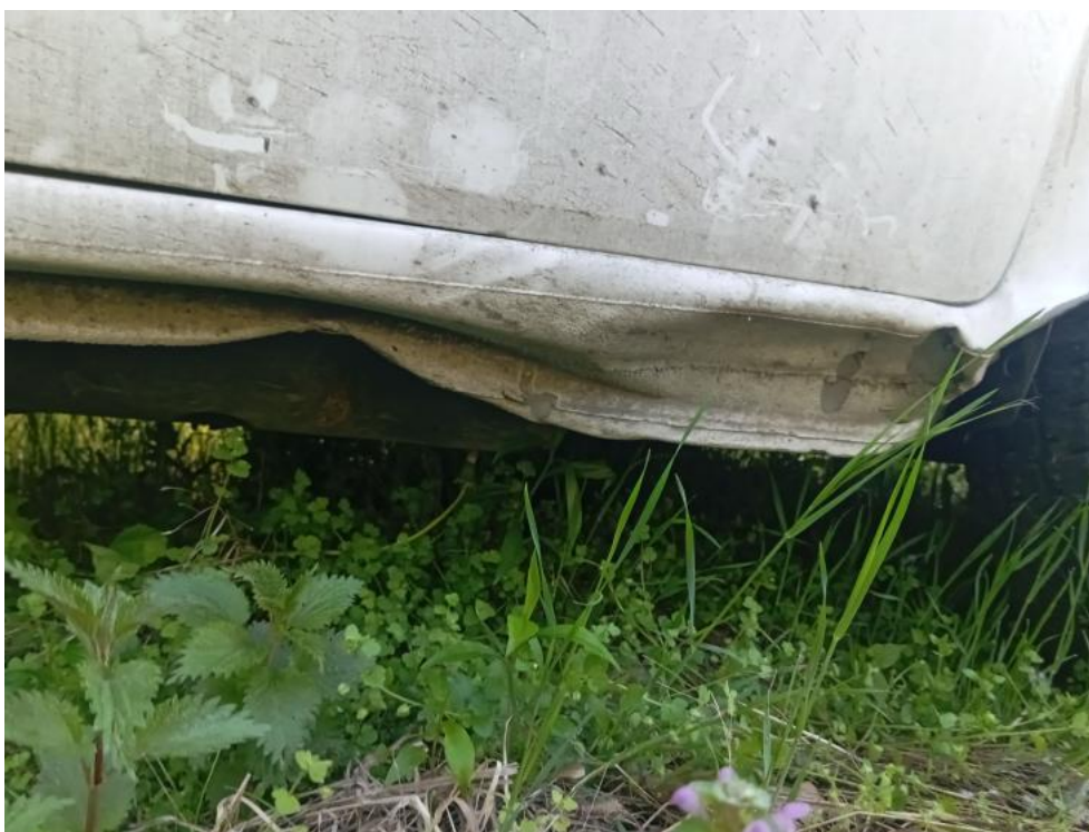
Fot. 43. P - deformacja 2