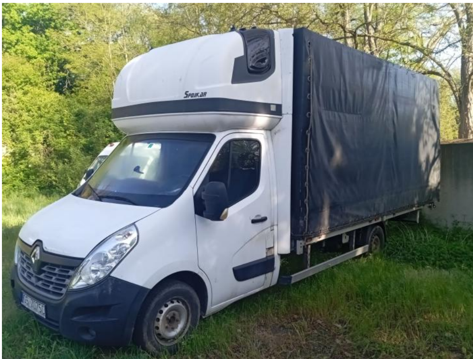
Fot. 1. Przekątna przednia lewa