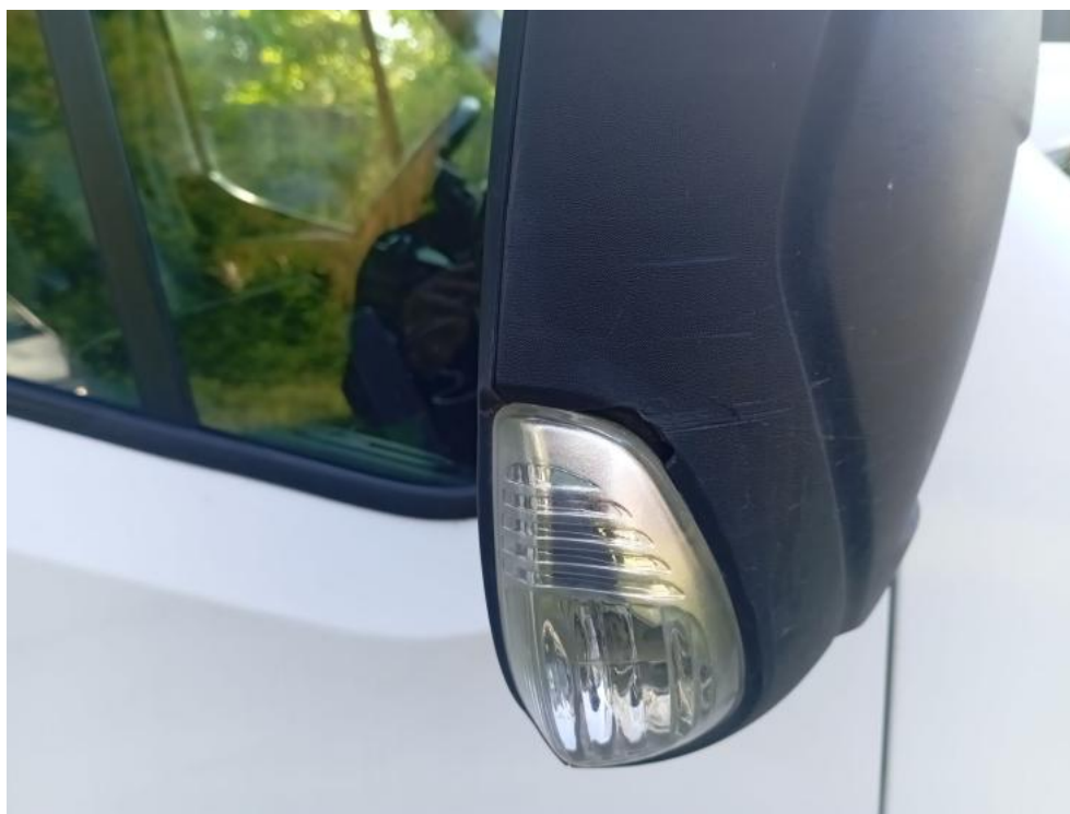
Fot. 46. P - zdjęcie poglądowe 2