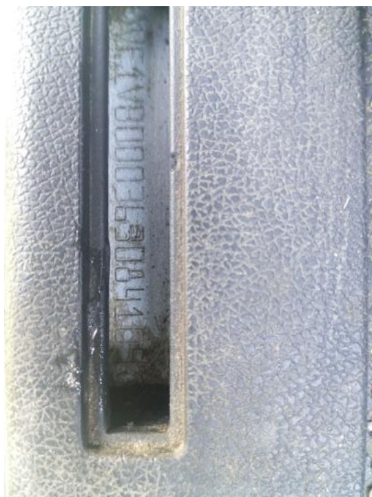
Fot. 19. Numer identyfikacyjny