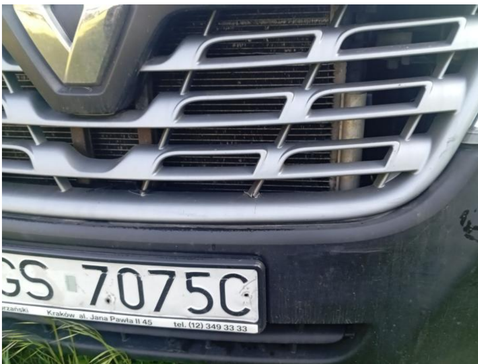
Fot. 62. - zdjęcie poglądowe 2