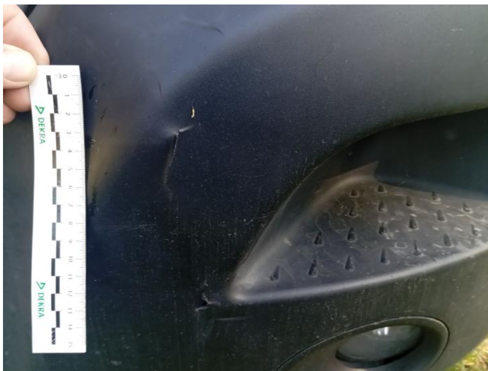
Fot. 76. PRZ() - pęknięcie 3