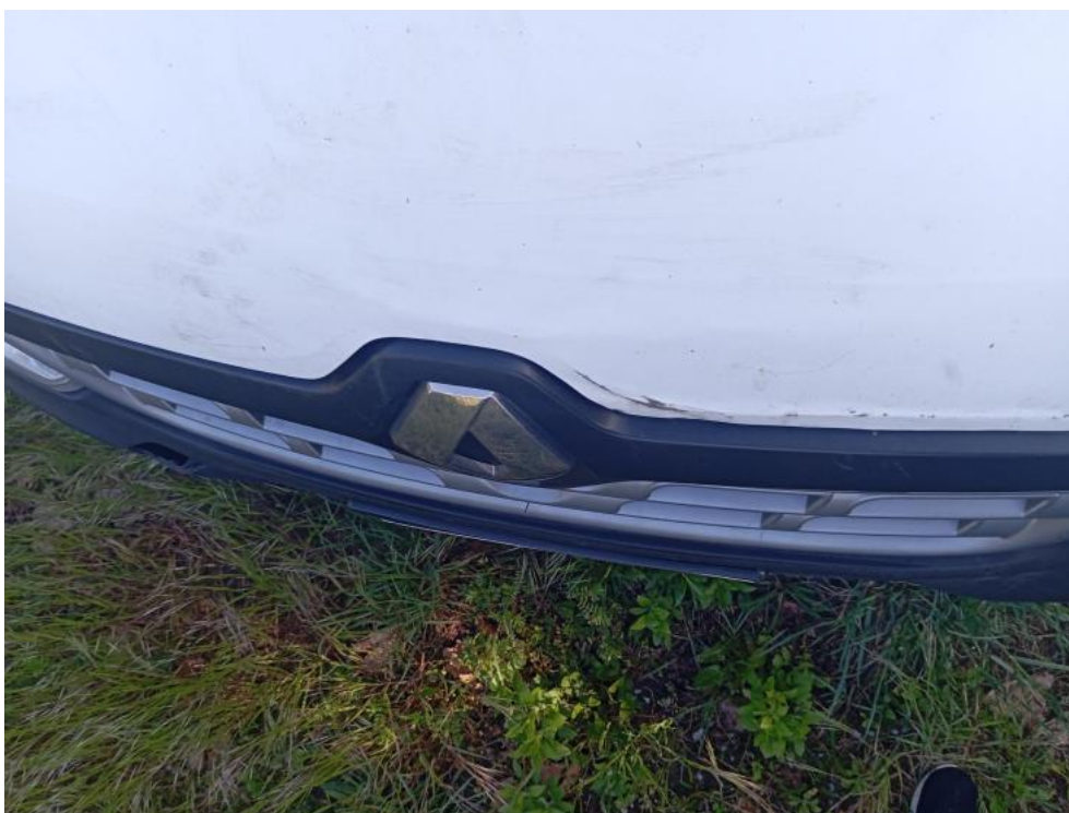
Fot. 66. - zdjęcie poglądowe 1