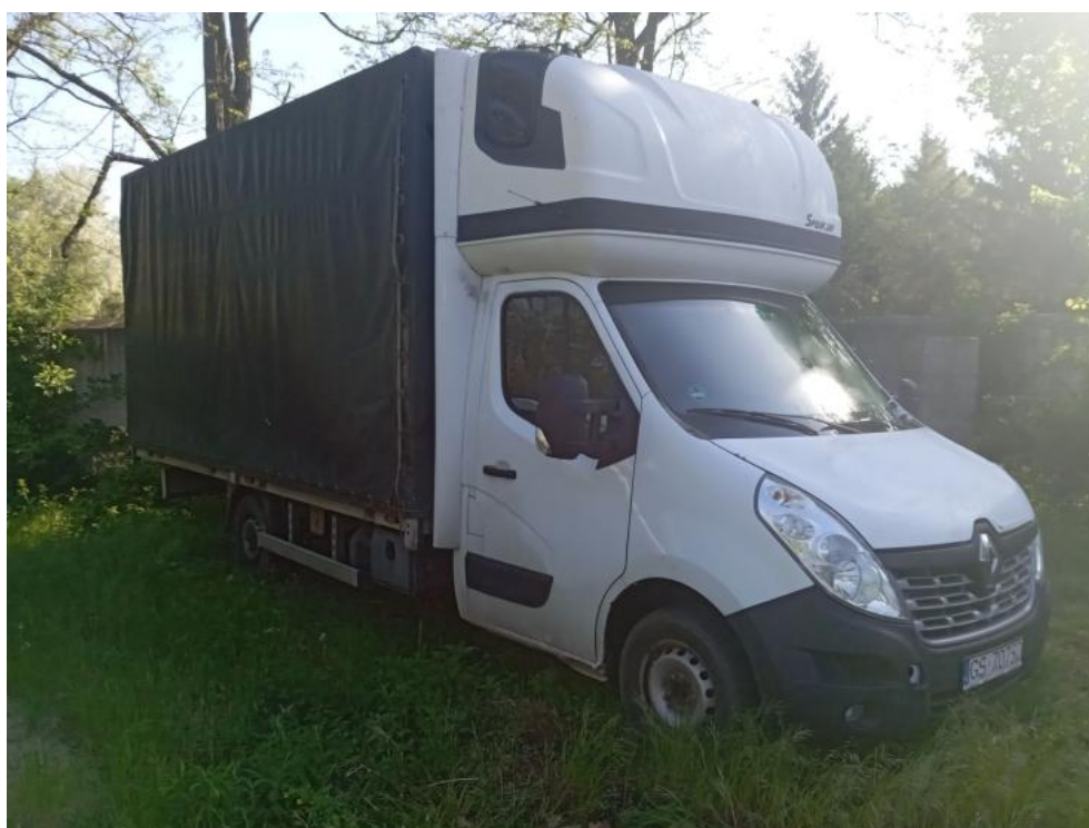
Fot. 6. Przekątna przednia prawa