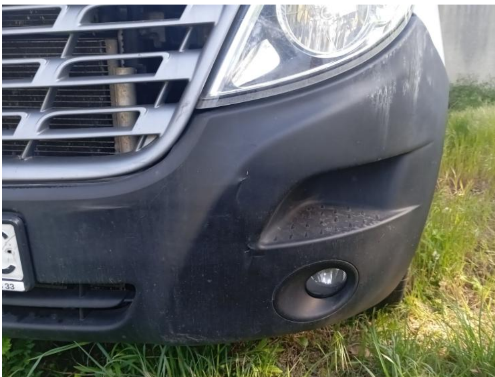
Fot. 74. PRZ - zdjęcie poglądowe 2