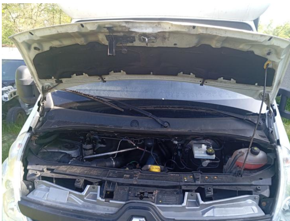
Fot. 4. Otwarta pokrywa przednia