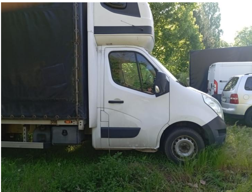
Fot. 7. Bok praw. prost. część prz. dol.