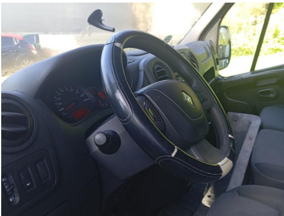
Fot. 26. Kierownica z lewej strony