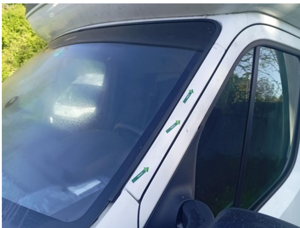
Fot. 54. L - wgniecenie 1