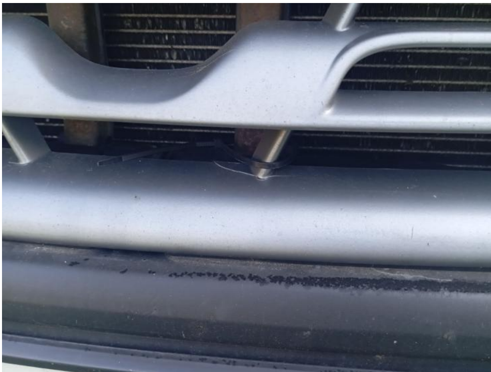
Fot. 65. ( ) - pęknięcie 3