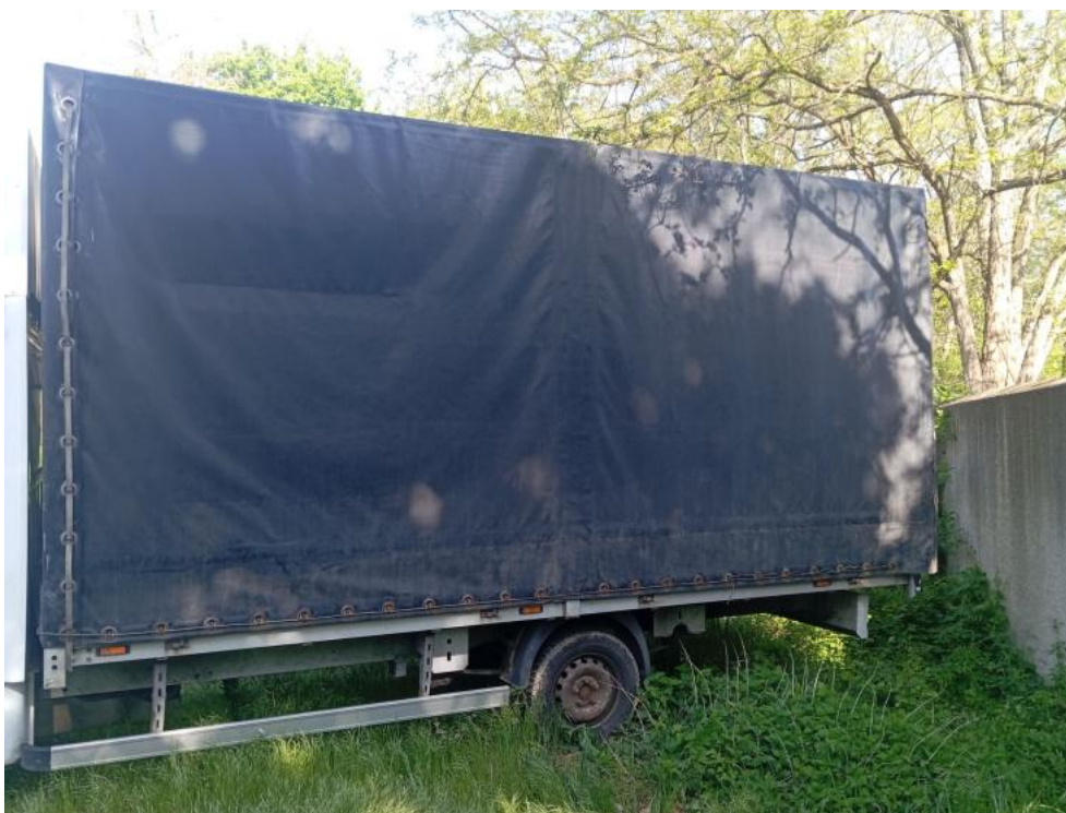
Fot. 16. Bok lew. prost. część tyl.