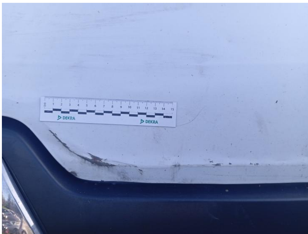
Fot. 69. - deformacja 2