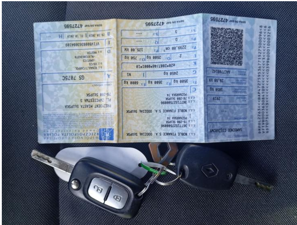
Fot. 33. Dow. Rej. Str.2 i klucze