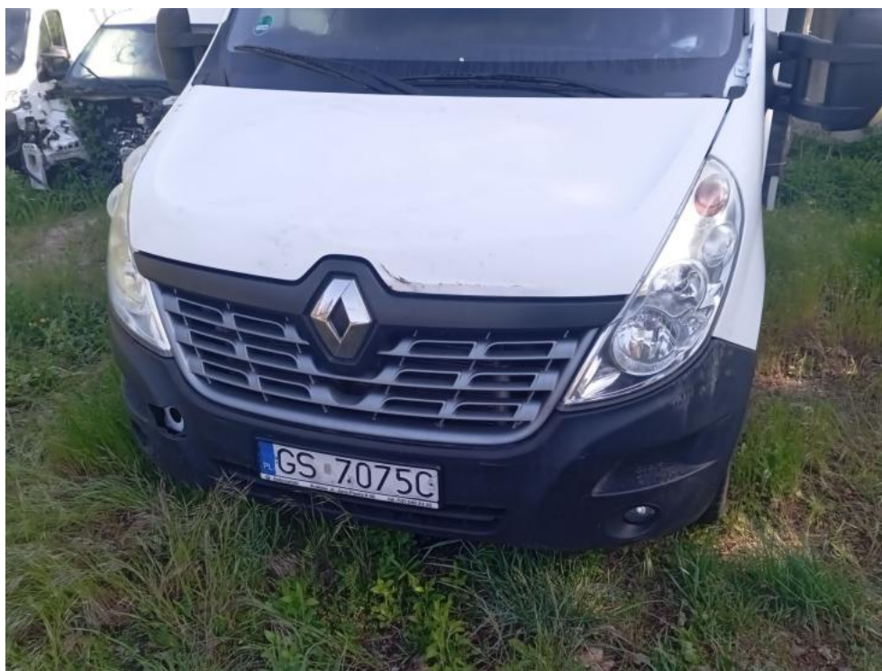
Fot. 75. PRZ - pęknięcie 1