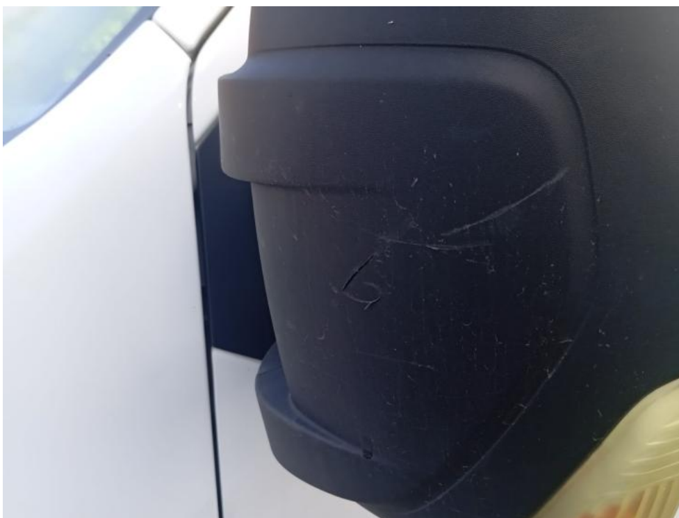
Fot. 58. L - zdjęcie poglądowe 2