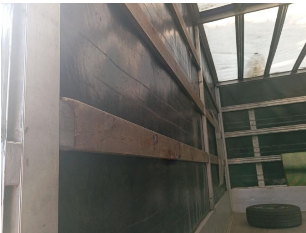
Fot. 37. Zdjęcie do protokołu