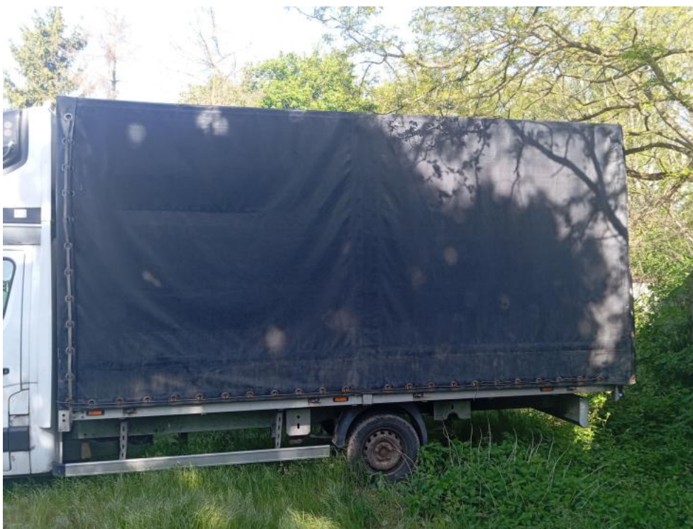
Fot. 15. Przekątna tylna lewa