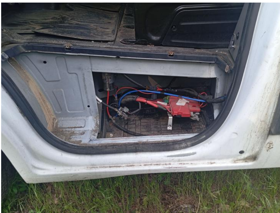
Fot. 38. Zdjęcie do protokołu