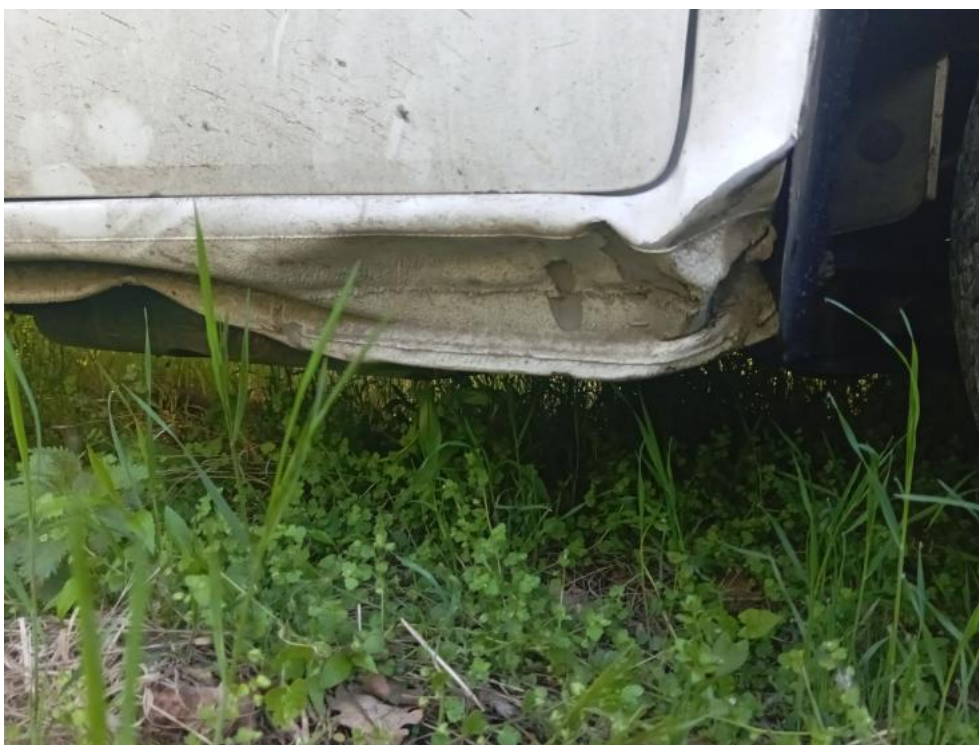
Fot. 41. P - zdjęcie poglądowe 2