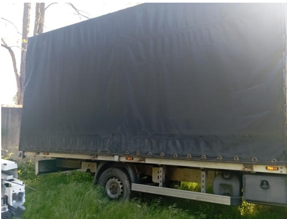
Fot. 10. Bok praw. prost. część tyl.