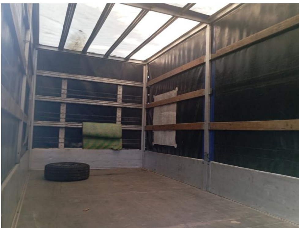
Fot. 30. Wnętrze zabudowy