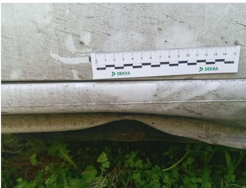
Fot. 44. P() - deformacja 3