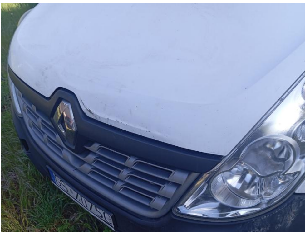
Fot. 67. - zdjęcie poglądowe 2