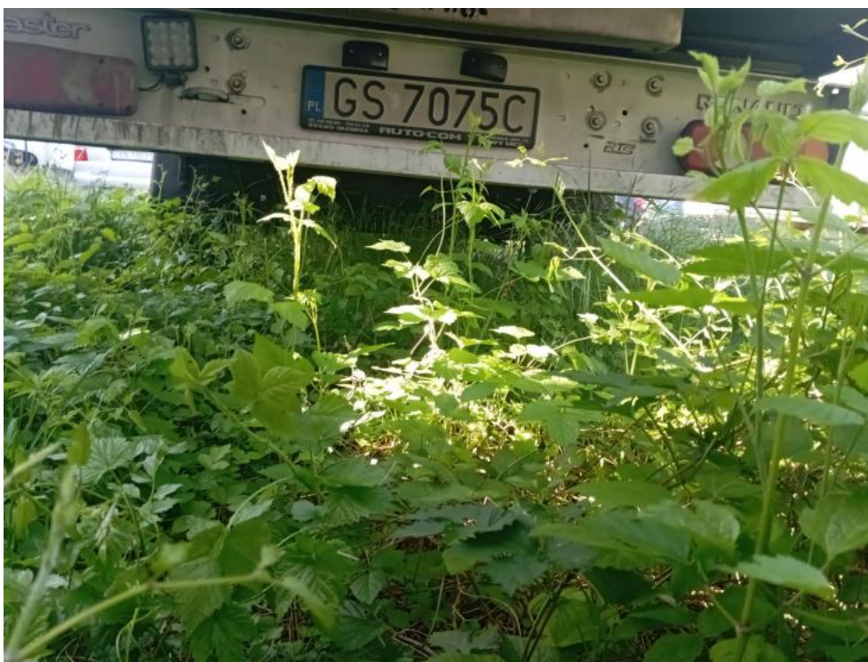
Fot. 14. Spód tył