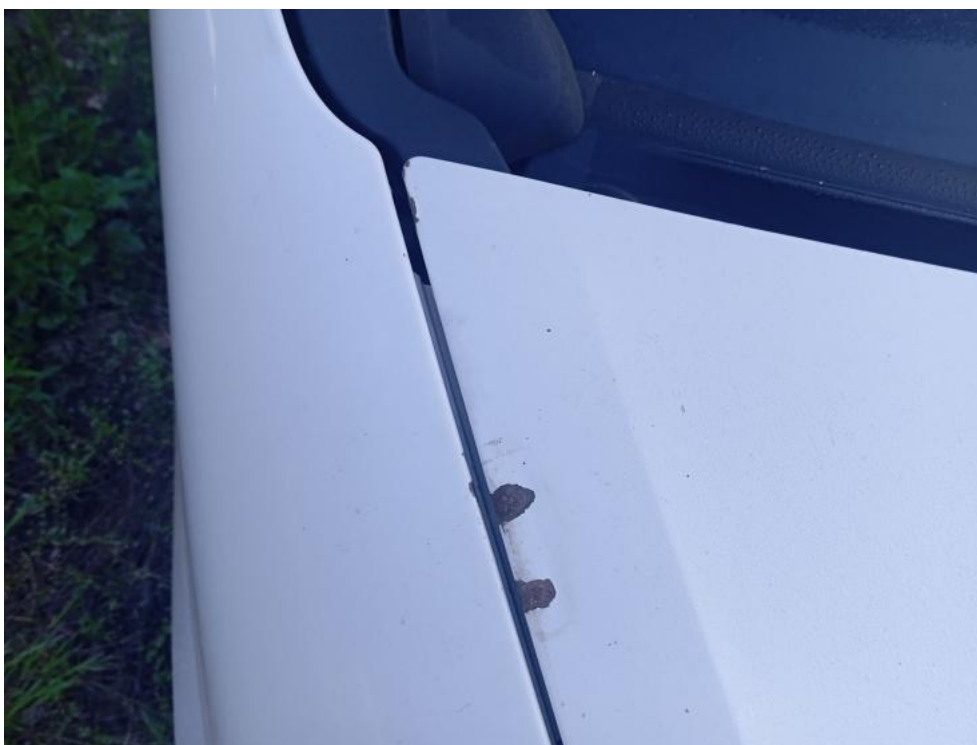
Fot. 72. ( ) - korozja 3