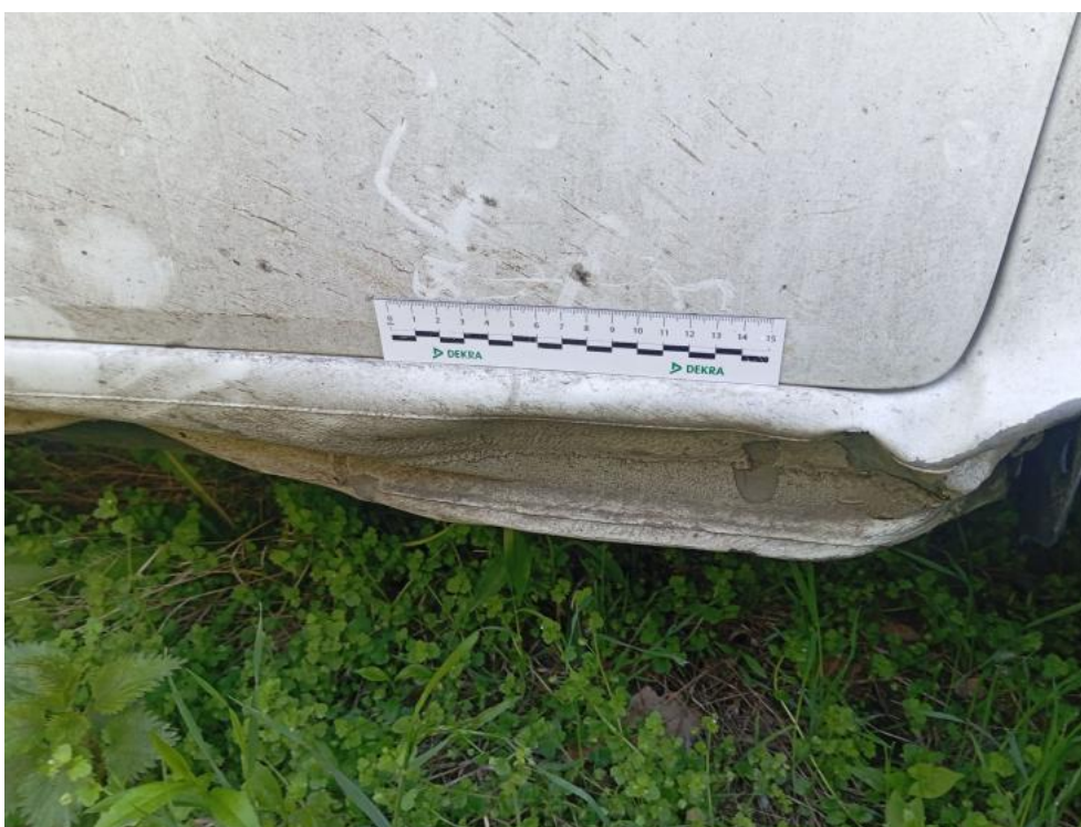
Fot. 40. P - zdjęcie poglądowe 1