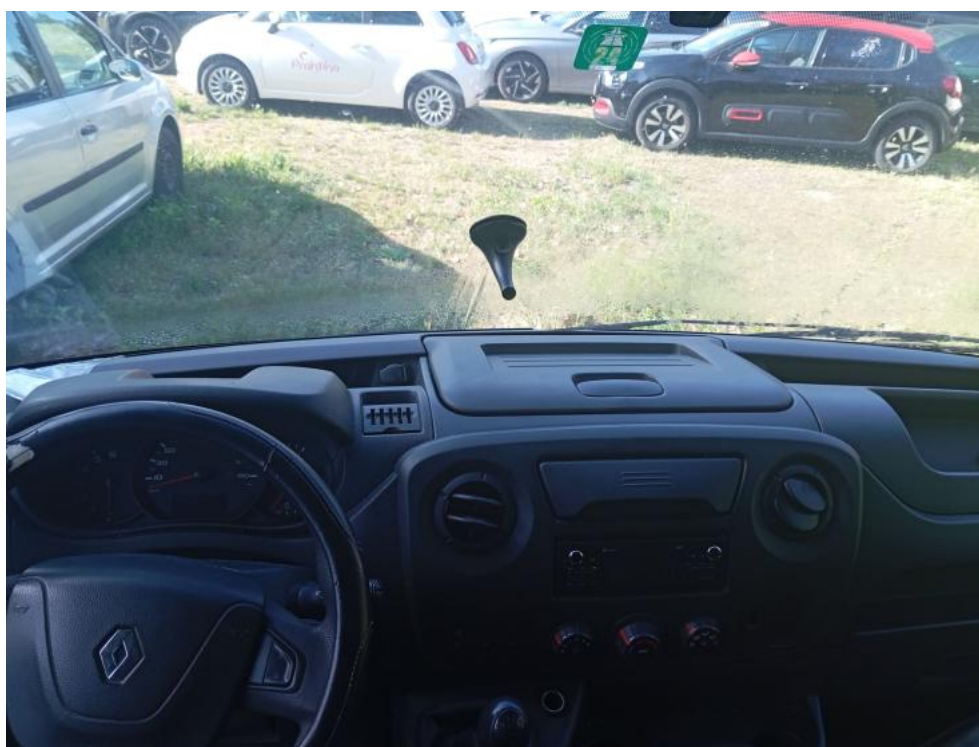
Fot. 22. Deska rozdzielcza