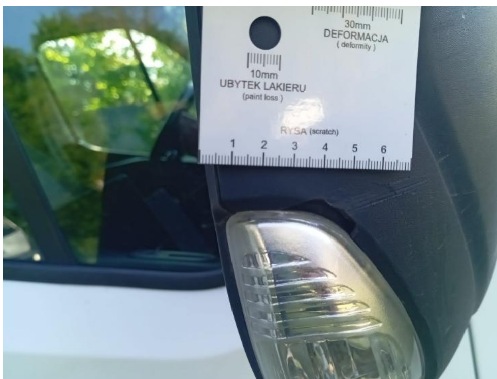
Fot. 45. P - zdjęcie poglądowe 1