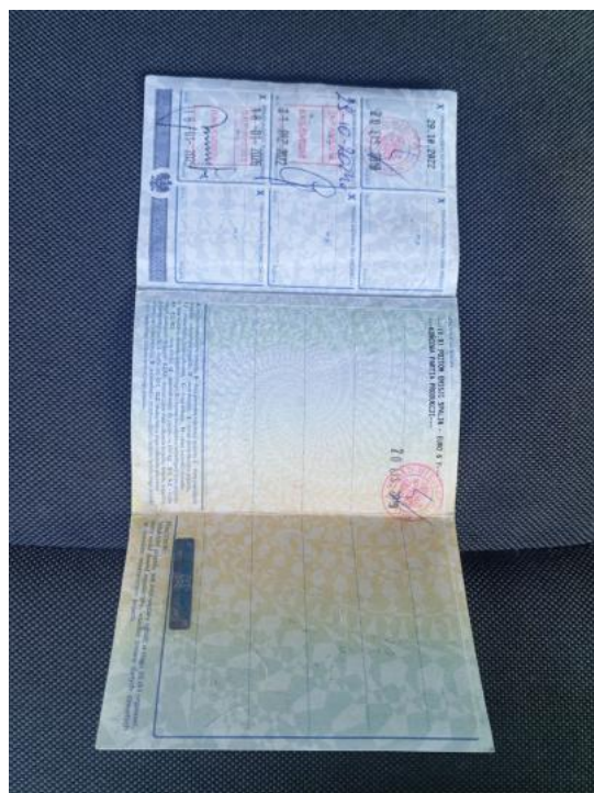
Fot. 32. Dowód rej. Str. 1