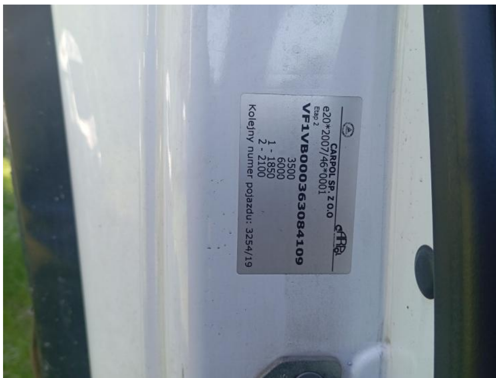
Fot. 31. Tabliczka znamionowa zabudowy