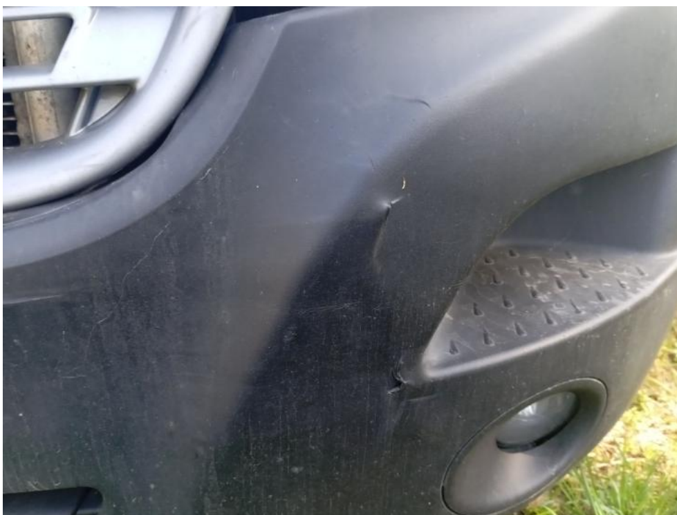
Fot. 73. PRZ - zdjęcie poglądowe 1