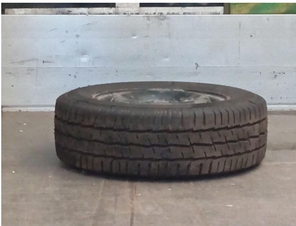
Fot. 29. Koło zapasowe