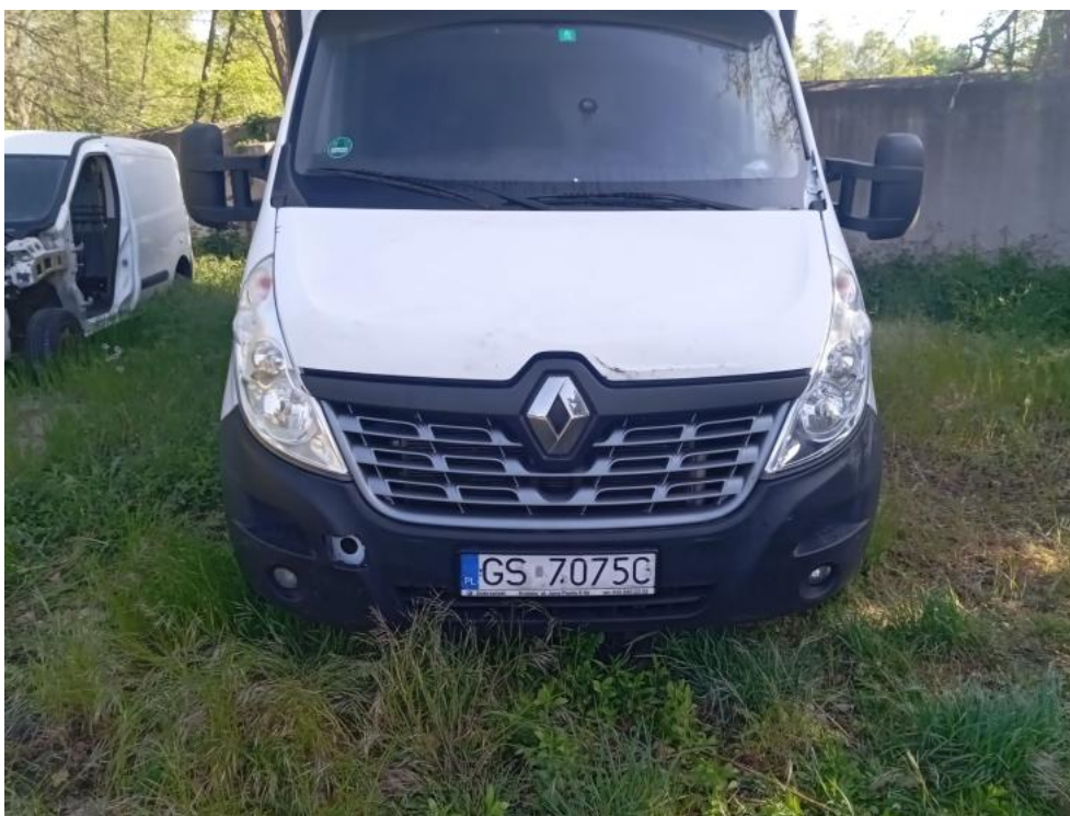
Fot. 2. Przód prostopadle dół