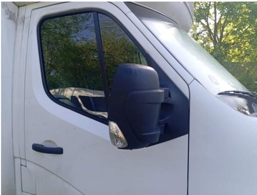
Fot. 47. P - pęknięcie 1