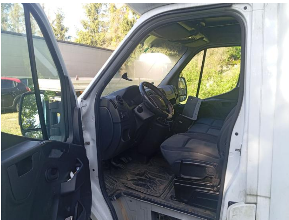
Fot. 9. Widok przez otwarte drzwi przednie lewe