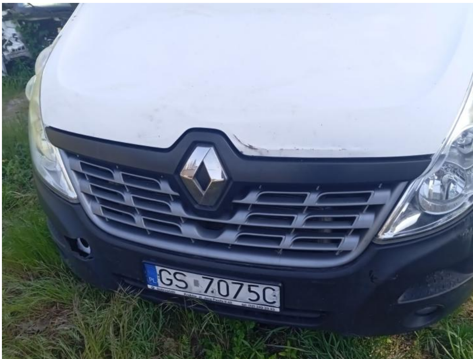
Fot. 63. - pęknięcie 1