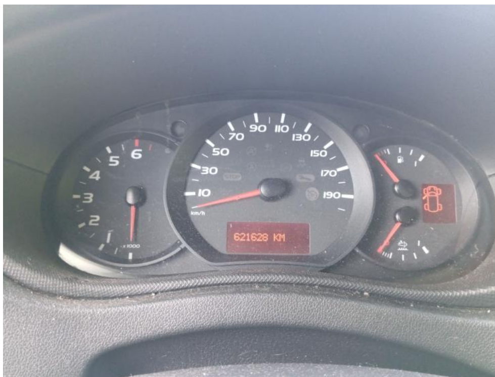
Fot. 21. Zestaw wskaźników