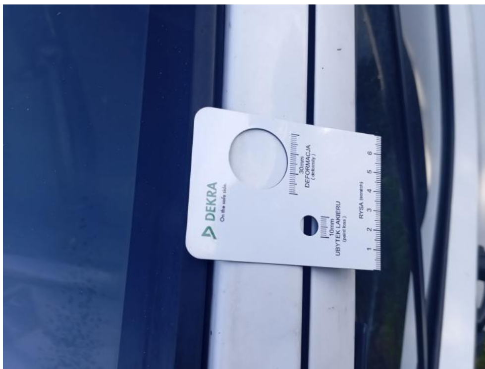
Fot. 55. L - wgniecenie 2