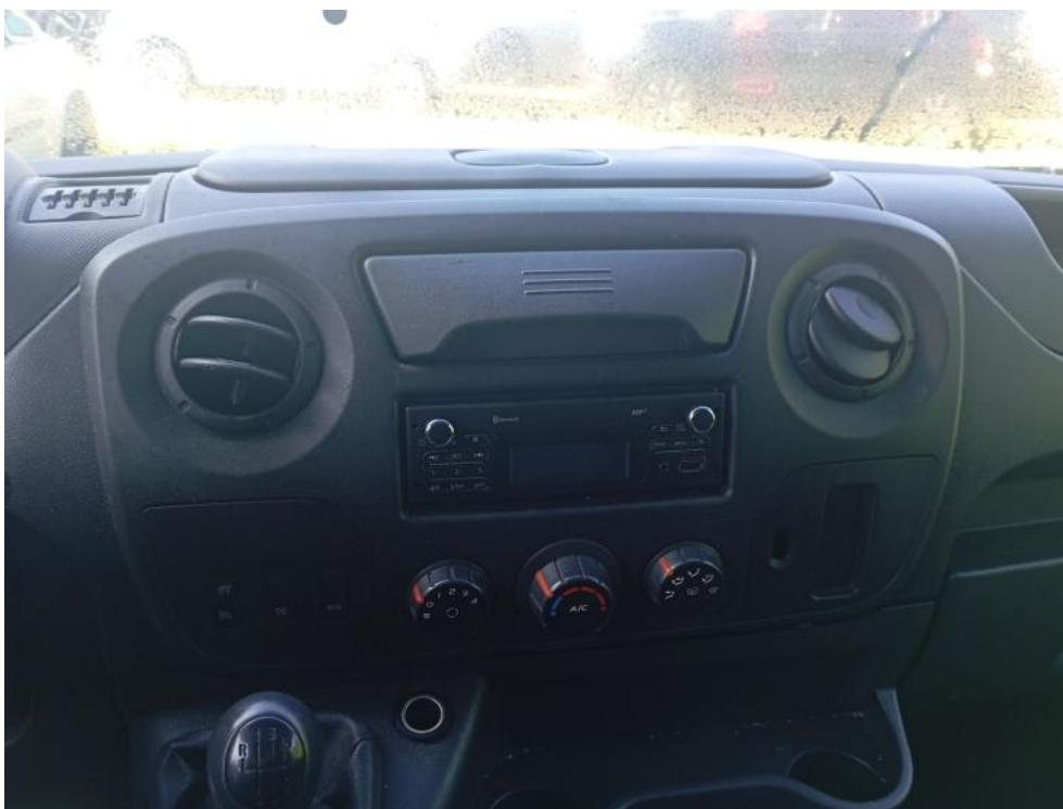
Fot. 23. Konsola środkowa