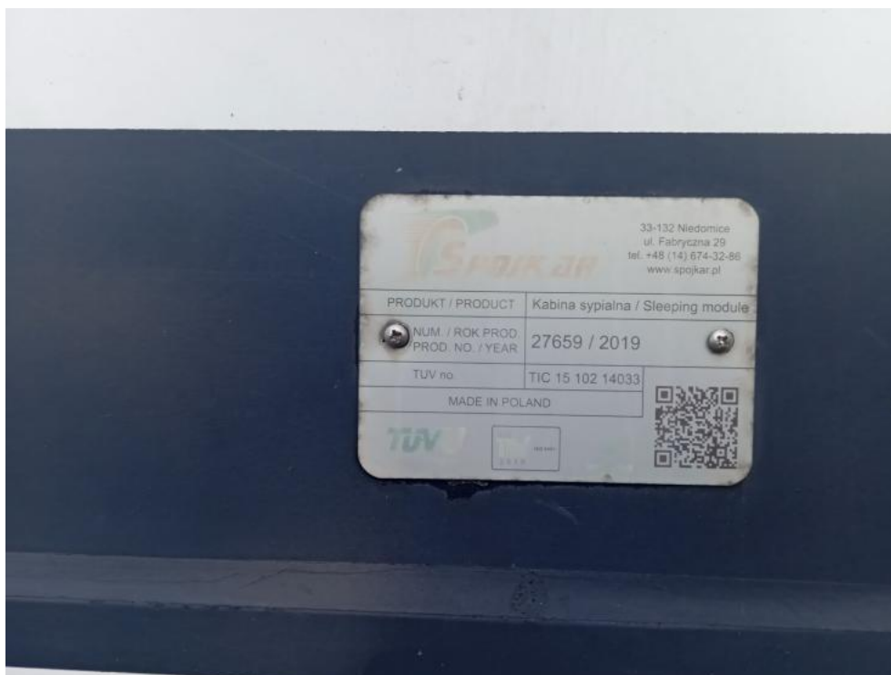
Fot. 34. Zdjęcie do protokołu