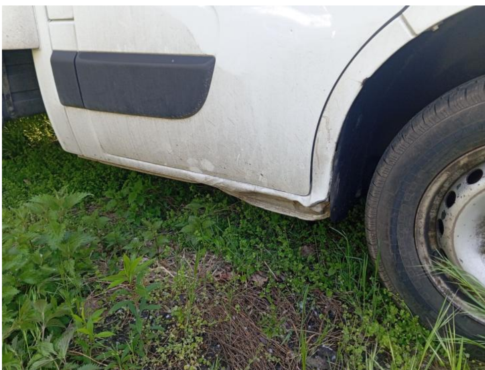
Fot. 42. P - deformacja 1