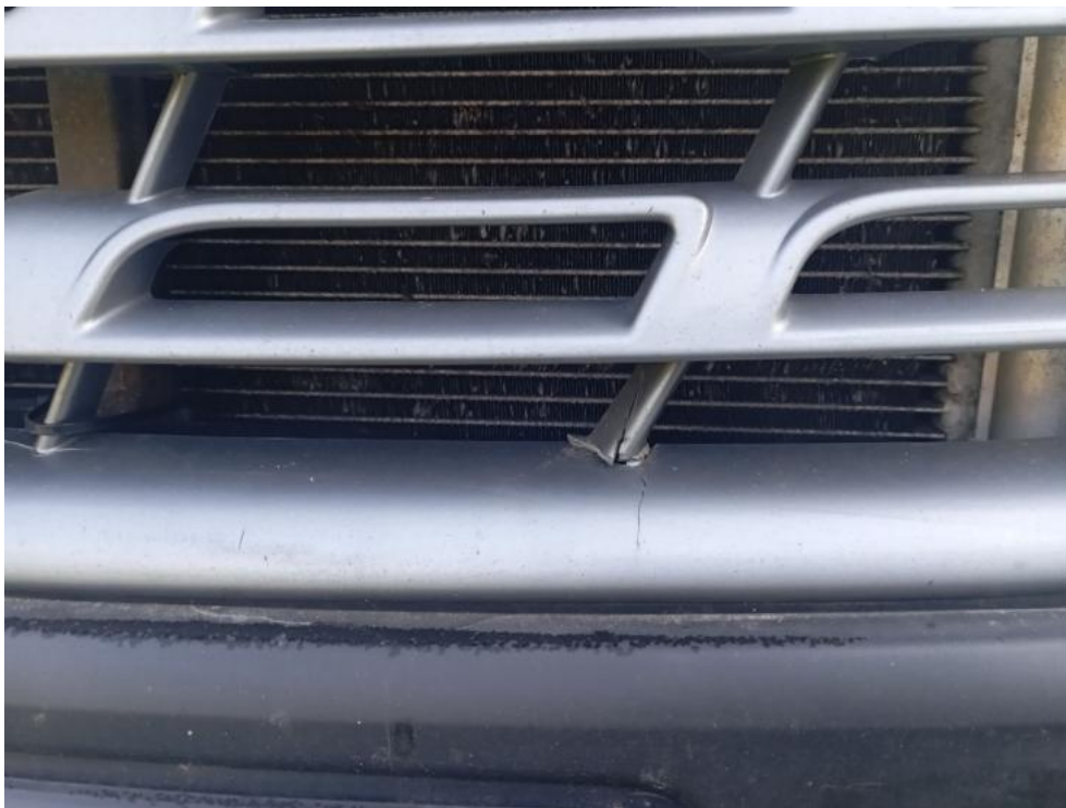
Fot. 61. - zdjęcie poglądowe 1