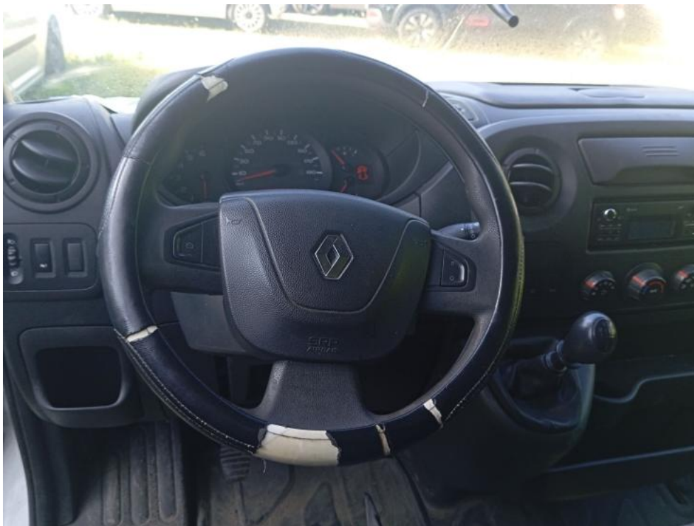
Fot. 25. Kierownica (na wprost)