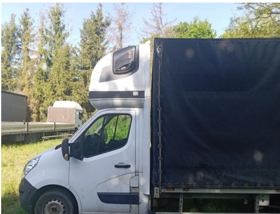
Fot. 18. Bok lew. prost. część prz. gór.