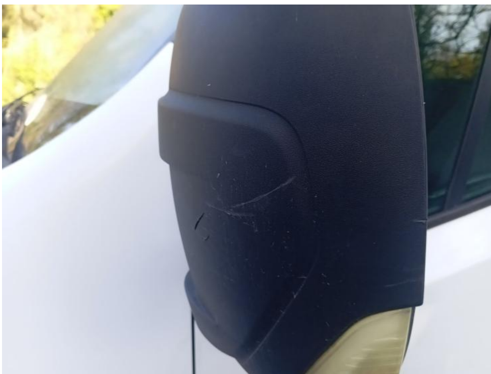
Fot. 57. L - zdjęcie poglądowe 1