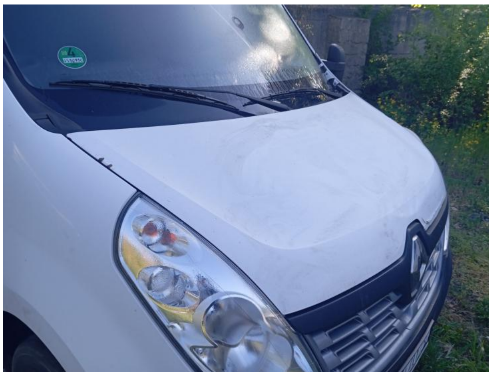
Fot. 70. - korozja 1