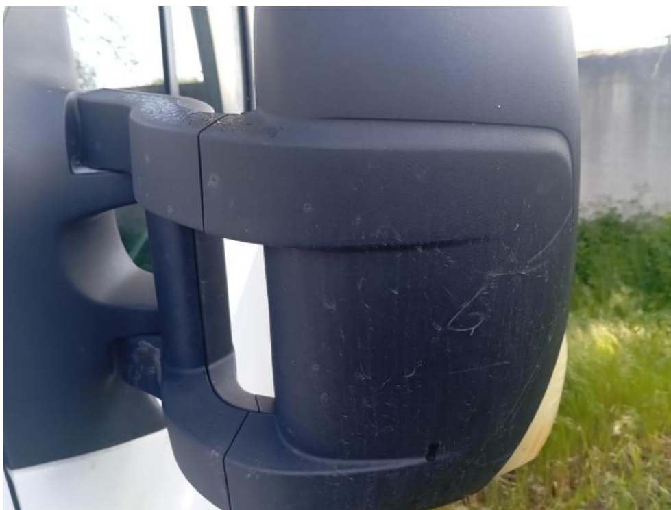
Fot. 60. L() - zarysowanie 3