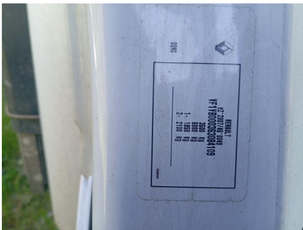
Fot. 20. Tabliczka znamionowa