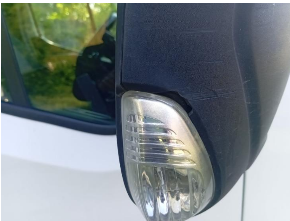
Fot. 48. P() - pęknięcie 3