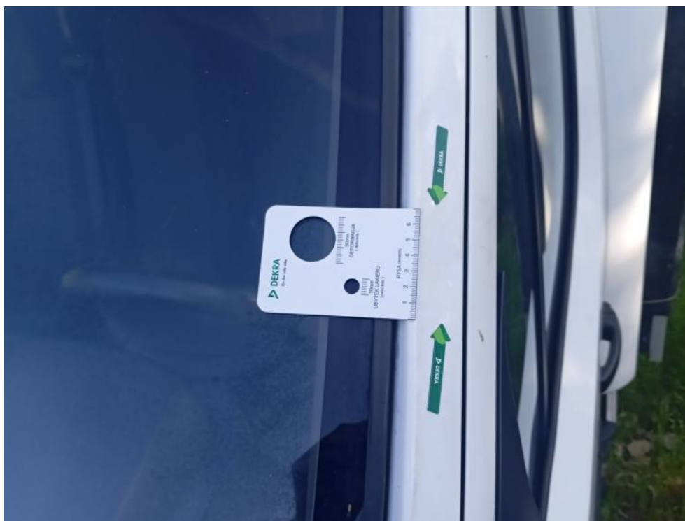
Fot. 56. L() - wgniecenie 3