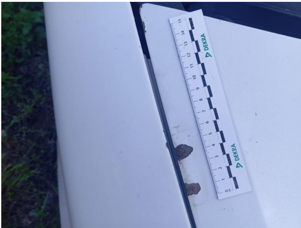
Fot. 71. - korozja 2