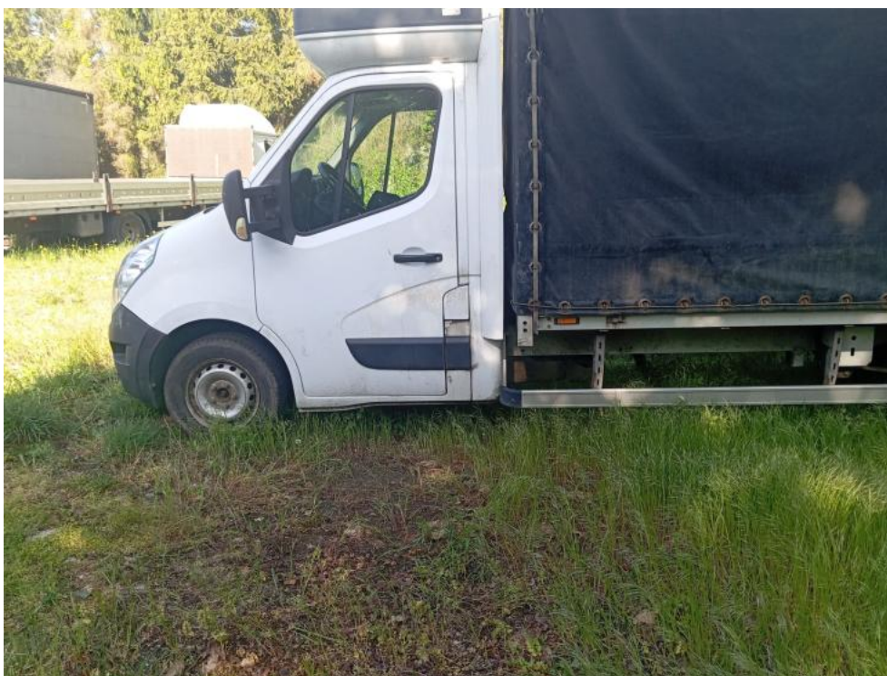
Fot. 17. Bok lew. prost. część prz. dol.