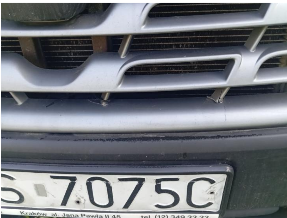
Fot. 64. - pęknięcie 2