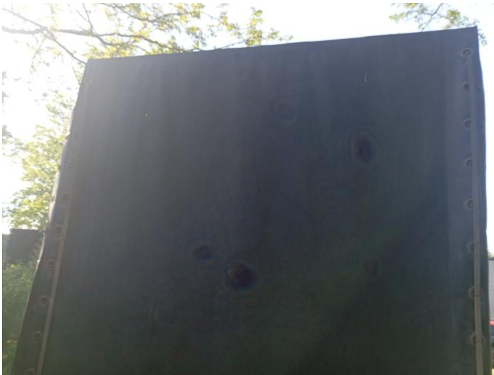
Fot. 13. Tył prostopadle góra