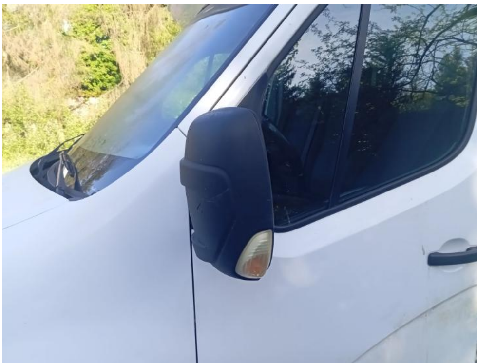
Fot. 59. L - zarysowanie 1