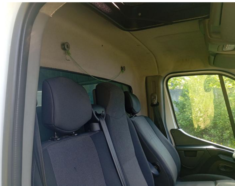
Fot. 28. Tył