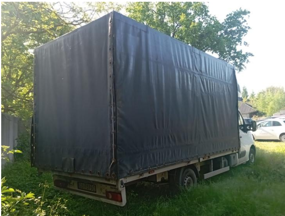
Fot. 11. Przekątna tylna prawa