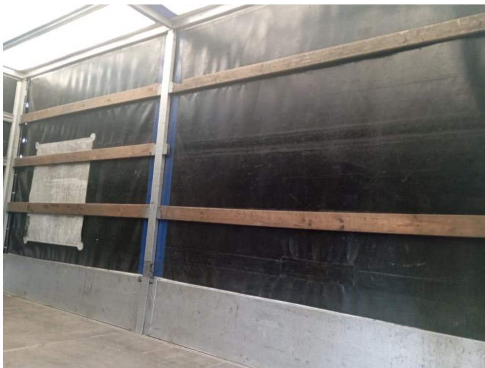
Fot. 35. Zdjęcie do protokołu