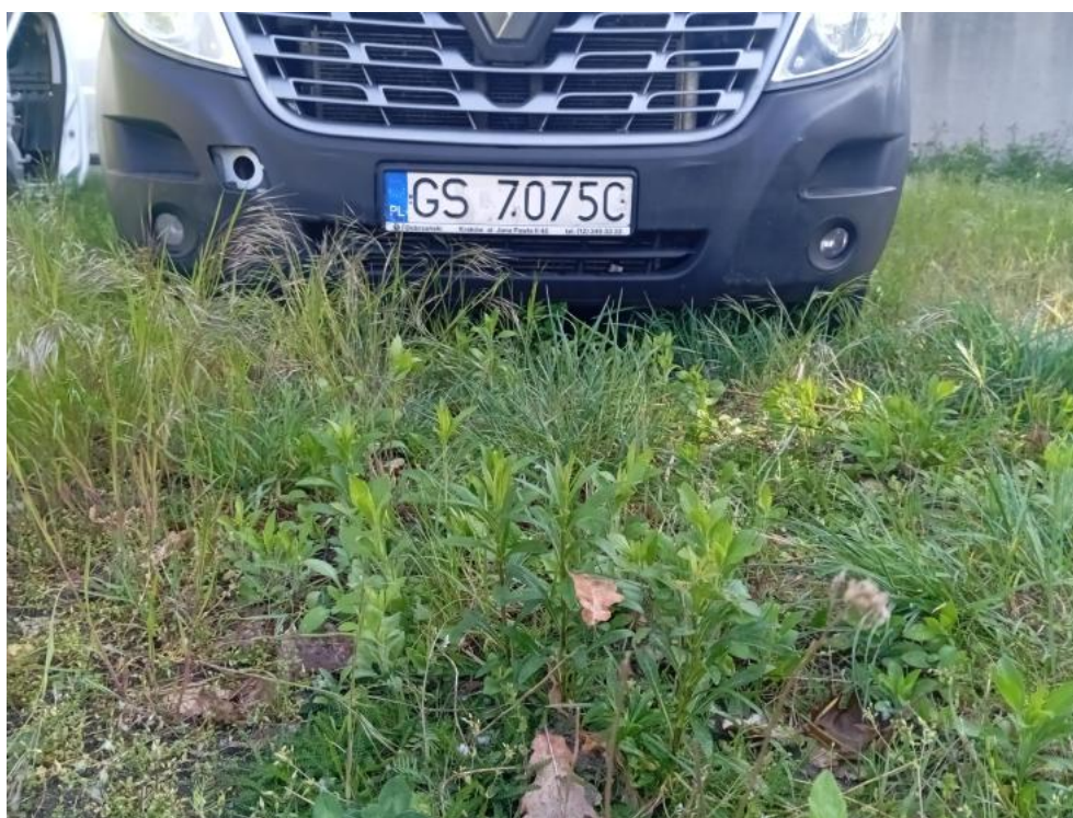
Fot. 5. Spód pojazdu przód