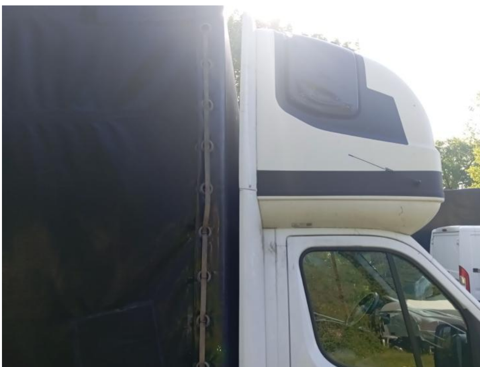
Fot. 8. Bok praw. prost. część prz. gór.