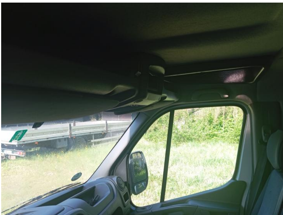
Fot. 24. Konsola/półka górna