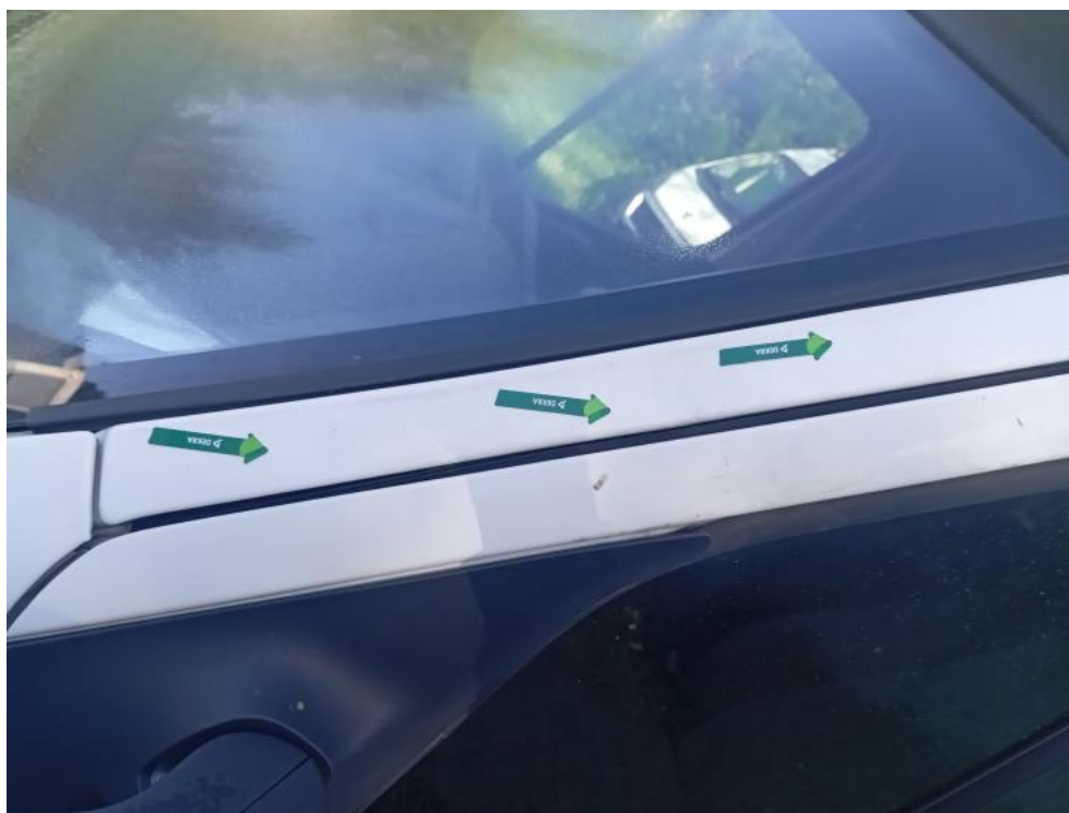
Fot. 53. L - zdjęcie poglądowe 2