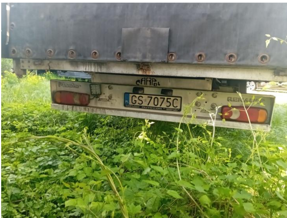
Fot. 12. Tył prostopadłe dół