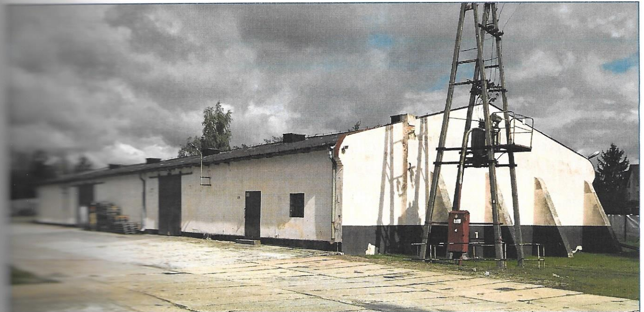
Elewacja frontowa i szczytowa

Budynek murowany, niepodpiwniczony, jednokondygnacyjny, kryty dachem dwuspadowym.