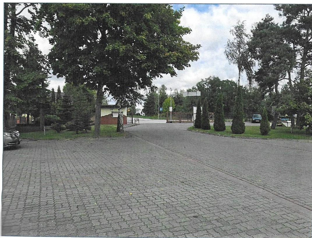
Nasadzenia drzew i krzewów ozdobnych