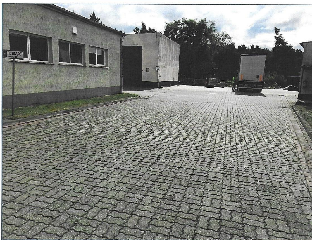
Utwardzenie terenu kostką betonową