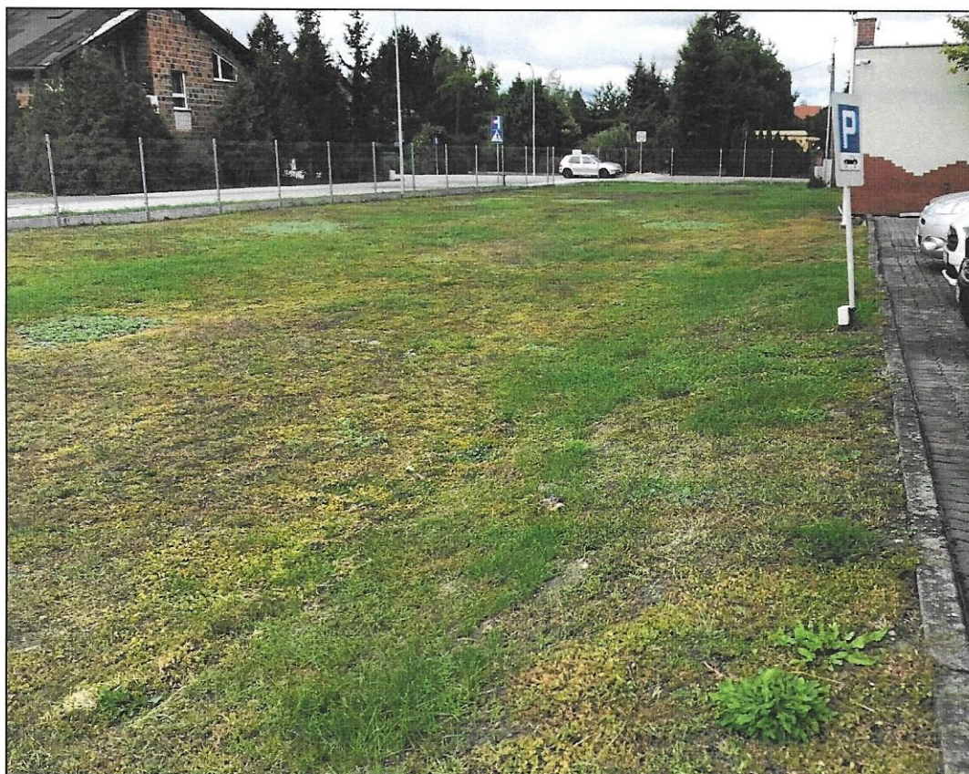
Niezabudowany teren działki 227/10 - trawnik