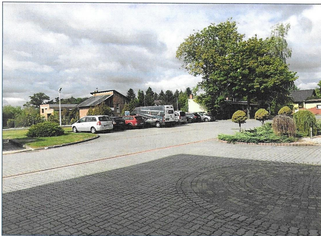
Wjazd na nieruchomość oraz parkingi utwardzone kostką betonową