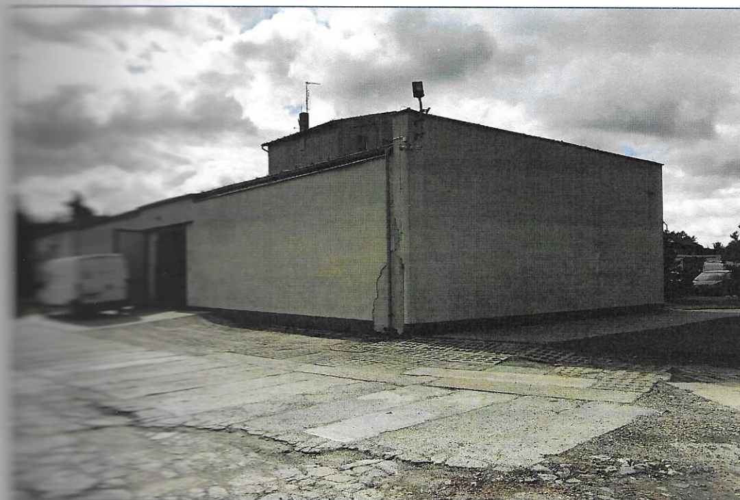
Elewacja frontowa i boczna