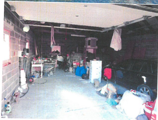
Fot. 29-31. Widok przedmiotu wyceny – budynek gospodarczy z garażem.

PROFCEN dr inż. Tomasz Budzik 42-200 Częstochowa, ul. Wodzickiego 84/90/25 BIKRO: ul. Dekabrystów 41/916 NIP: 573-26-888-37