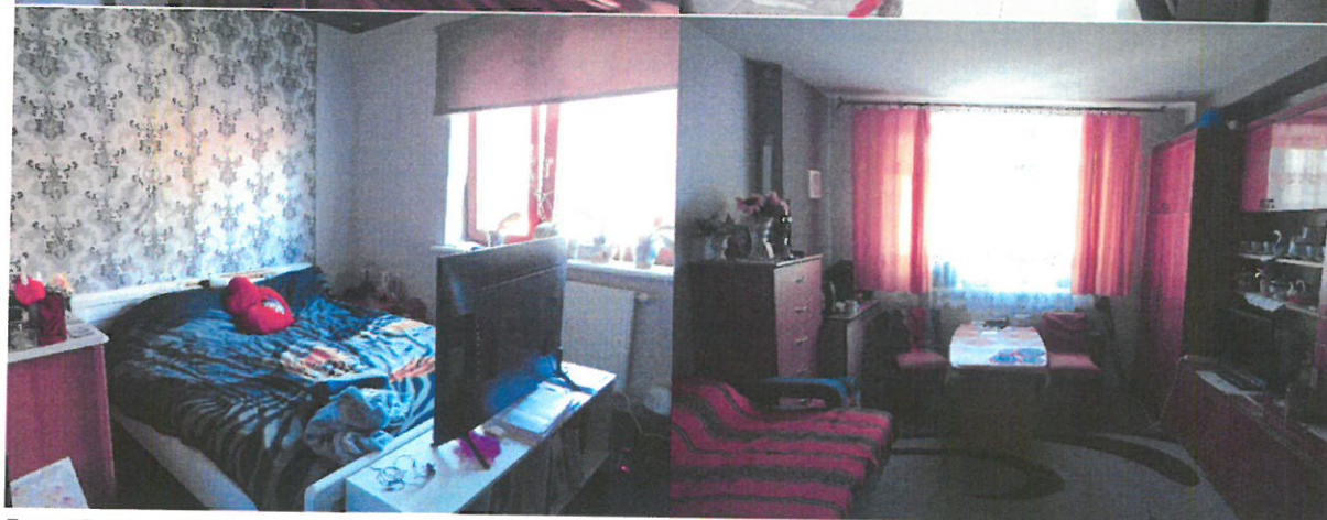
Fot. 17-20. Widok przedmiotu wyceny – budynek mieszkalny, parter.