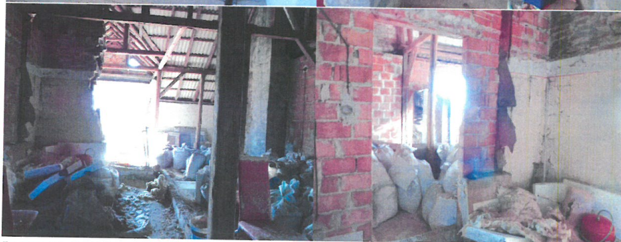
Fot. 21-24. Widok przedmiotu wyceny – budynek mieszkalny, poddasze użytkowe.

PROFCEN dr inż. Tomasz Budzik 42-200 Częstochowa, ul. Wodzickiego 84/90/25 BIURO: ul. Dekabrystów 41/916 NIP: 573-26-888-37