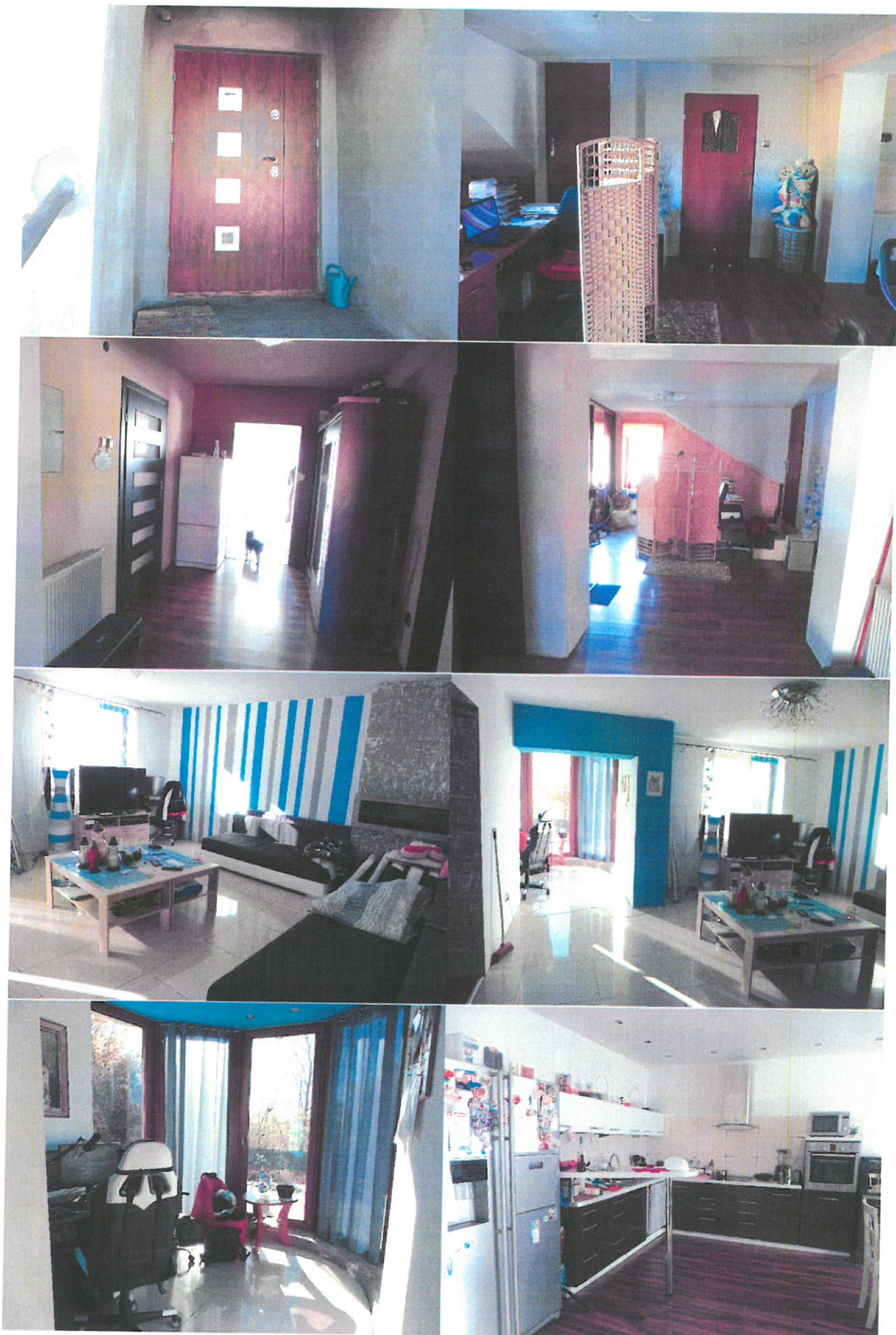
Fot. 9-16. Widok przedmiotu wyceny – budynek mieszkalny, parter.

PROFCEN dr inż. Tomasz Budzik 42-200 Częstochowa, ul. Wodzickiego 84/90/25 BIURO: ul. Dekabrystów 41/916 NIP: 573-26-888-37