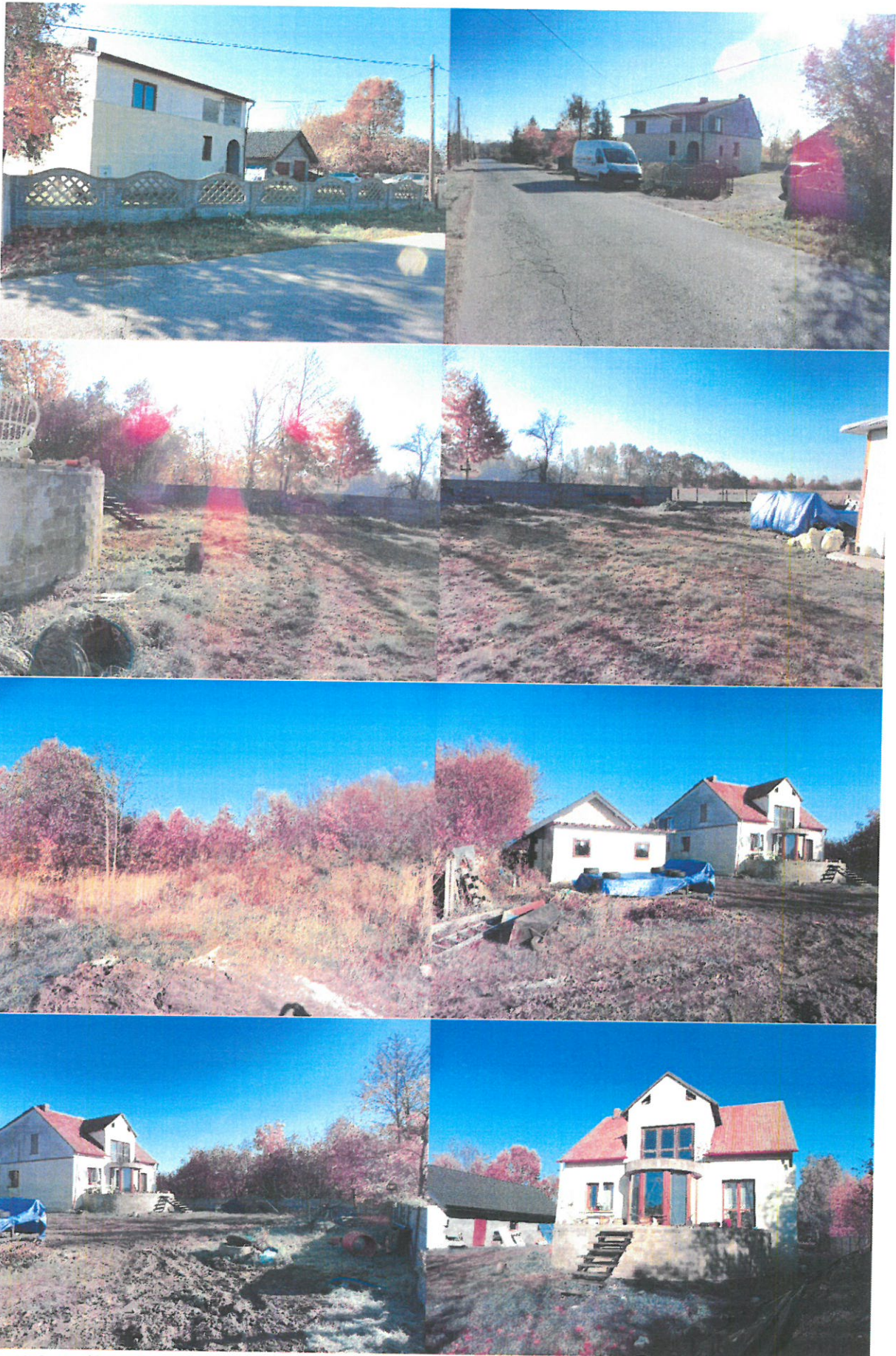
Fot. 1-8. Ogólny widok przedmiotu wyceny.

PROFCEN dr inż. Tomasz Budzik 42-200 Częstochowa, ul. Wodzickiego 84/90/25 BIURO: ul. Dekabrystów 41/916 NIP: 573-26-888-37