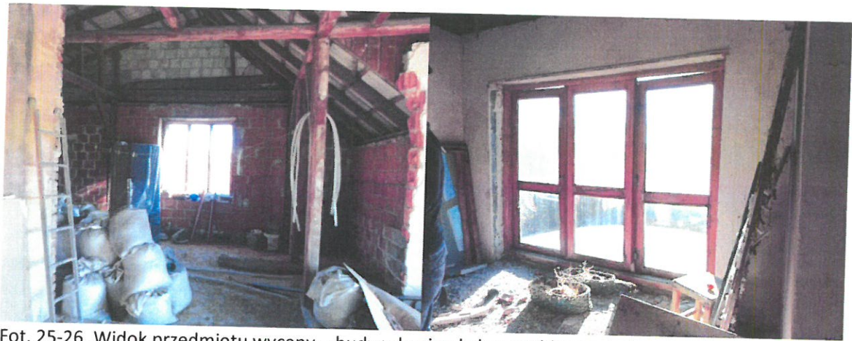
Fot. 25-26. Widok przedmiotu wyceny – budynek mieszkalny, poddasze użytkowe.